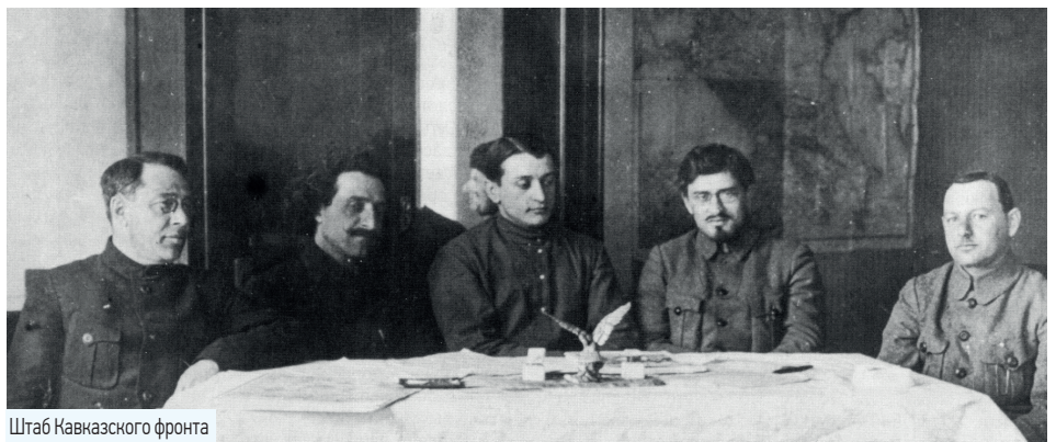
Штаб Кавказского фронта