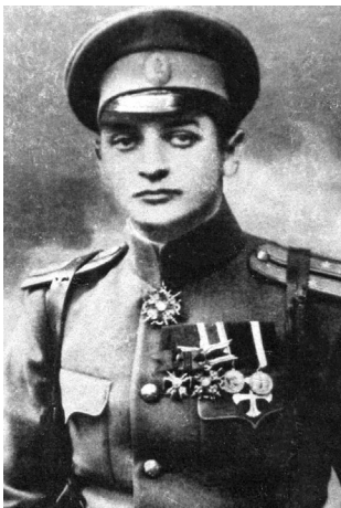
Рис. 2. Фотоколлаж: на фотографию М.Н. Тухачевского наложено изображение военной формы, взятой с фотографии другого офицера лейб-гвардии Семеновского полка И.Н. Толстого. У М.Н. Тухачевского также были награждения, что подтверждается документально

Приведём яркие примеры грубых ошибок и просто курьёзных подписей.