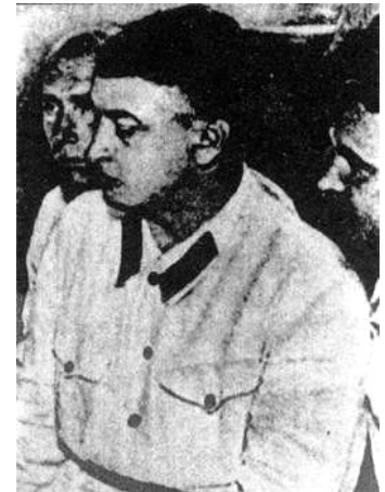
Рис. 3. Фотография, традиционно (при вырезании фрагмента с М.Н.Тухачевским) выдаваемая за снимок из «зала суда» 11 июня 1937 г.

4. использование не относящихся к делу снимков, зачастую с непонятной информационной ценностью, для эмоционального воздействия на читателя. Здесь укажем иллюстрацию «Зал судебных заседаний» (стр. 43) с изображением двери зала и таблички на ней или постановочный кадр, подписанный как «Доносчик» (стр. 45) с мужчиной, звонящим по телефону, вероятно, с «сигналом». Фотография «Форма морского офицера» (стр. 55) также не несёт особенной смысловой нагрузки, в главе рассказывается о «чистке» на флоте после кронштадтских событий. Поскольку автор ставил целью исследовать «общую атмосферу в СССР 30-х годов XX века и роль И. В. Сталина в описываемых событиях», он злоупотребляет многократным размещением портретов