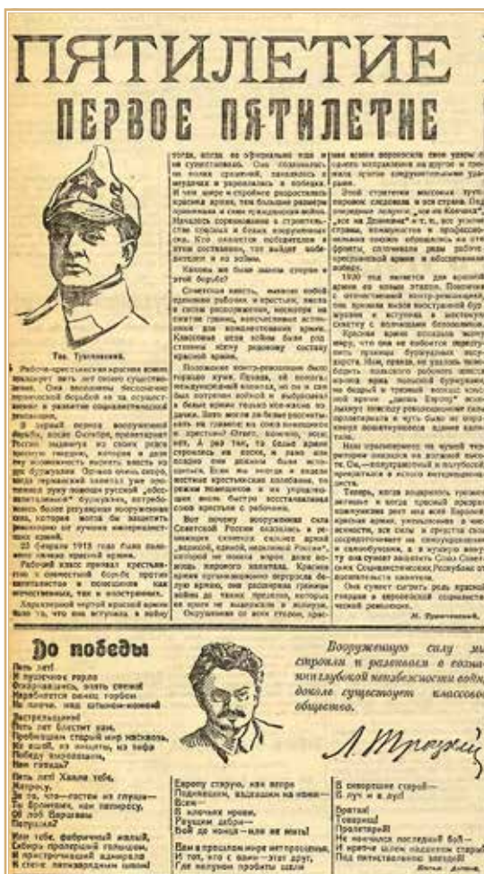
Рисунок 3. Статья М.Н. Тухачевского и обращение Л.Д. Троцкого в газете «Гудок». 23 февраля 1923 г.

появлялось именно в смоленских газетах, так как тогда в этом городе располагался штаб Западного фронта, и Михаил Николаевич проживал здесь до ноября 1925 г. 84 Из газет мы узнаем, что 1 мая 1923 г. он присутствовал на праздничном параде 85 ; в День печати 5 мая — открывал конференцию военных журналистов Западного фронта, указав на необходимость создать художественный журнал для красноармейцев фронта 86 . 15 июля 1923 г. в рамках мероприятий «Недели помощи Воздушному флоту» Ту-