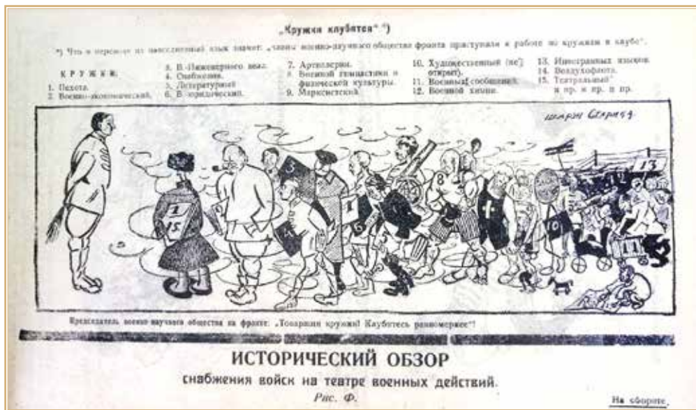
Рисунок 4. Дружеский шарж на М.Н. Тухачевского и членов ВНО Западного фронта, опубликованный в журнале «Революция и война». 1923 г.

На шарже изображены председатель ВНО фронта Тухачевский и стоящие перед ним руководители разнообразных кружков: военно-экономического, военно-инженерного дела, снабжения, артиллерии, военных сообщений, воздухфлота, иностранных языков и др. Несмотря на некоторую карикатурность, Михаил Николаевич вполне узнаваем, подчеркнуты особенности его внешности: прическа, выправка, профиль (рис. 4).