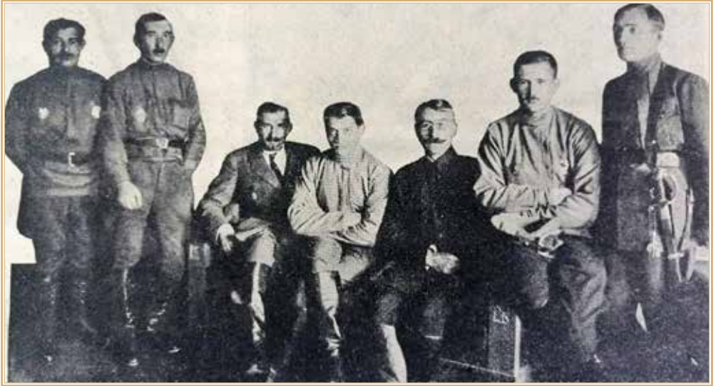
Рисунок 2. Штаб 1-й армии Восточного фронта. Четвертый справа — М.Н. Тухачевский, пятый — Н.И. Корицкий. 1918 г. Снимок был опубликован в журналах «Красный офицер» и «Красная звезда» в начале 1919 г.

ником 19 , вопреки сложившемуся мнению, и с кем у него были серьезные разногласия, вплоть до конфликтов 20 .